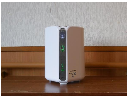
2階 特養 紅葉ユニットに設置