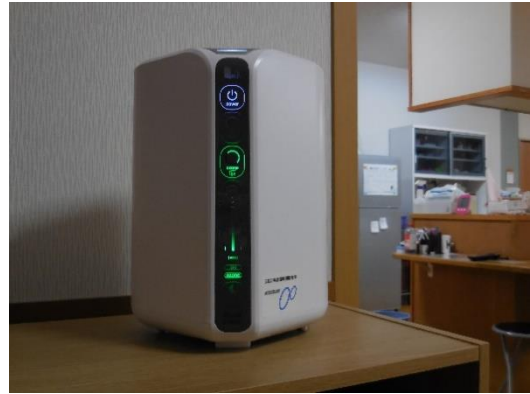
2階 特養 松ユニットに設置