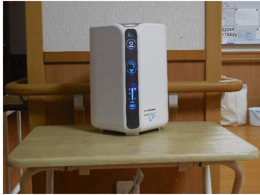
1階 特養 梅ユニットに設置