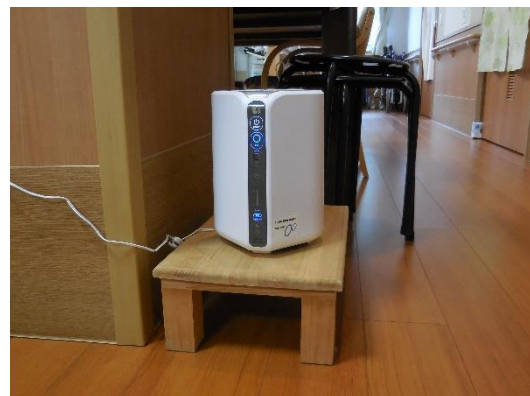
3階 短期 公孫樹ユニットに設置