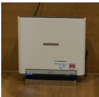
1階 ホール付近に設置

コロナ対策としてオゾン発生装置を1階ホール付近、特別養護老人ホーム、短期入所老人介護施設、通所老人介護施設、会議室、事務室へ設置して、コロナウイルスを不活性化し感染症の拡大防止に努める。