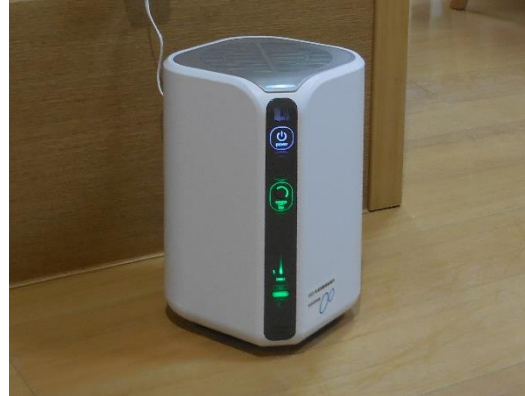
1階 通所 桜ユニットに設置